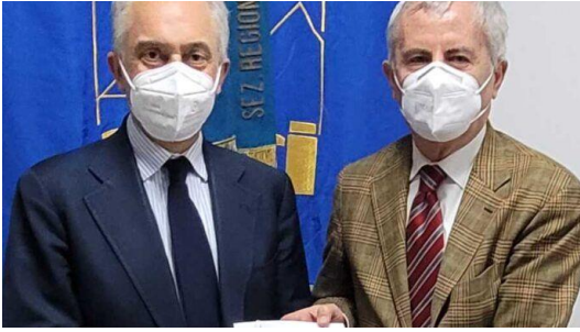
ANCI Campania - Portualità e demanio: convenzione tra Anci e Fondazione Ad Astra