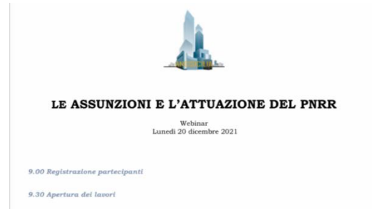
ANCI Sicilia - Le assunzioni e l'attuazione del PNRR