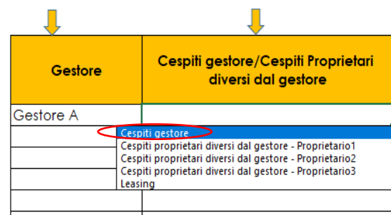
Figura 1-25 – Indicazione della proprietà dei cespiti