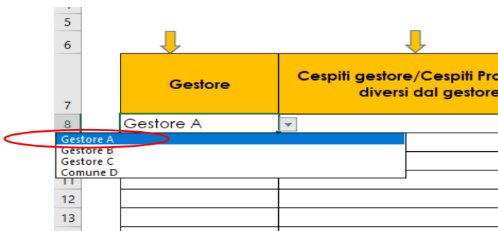
Figura 1-24 – Individuazione del gestore