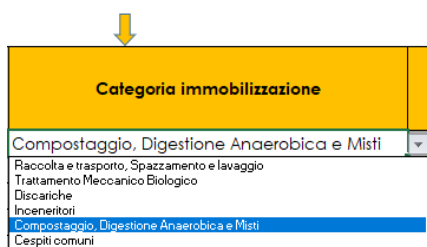
Figura 1-26 Indicazione categoria immobilizzazione