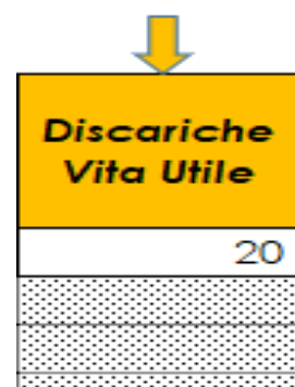
Figura 1-28 Indicazione Vita utile discariche