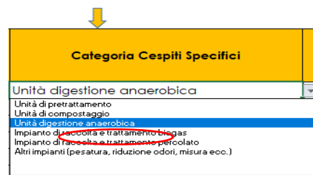
Figura 1-27 – Indicazione categoria cespite